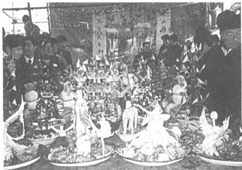
桃源集花供——走着瞧