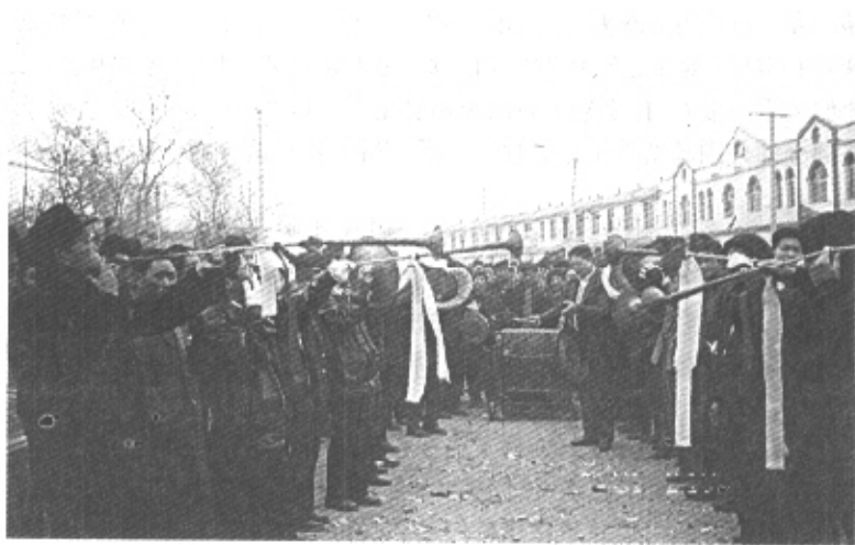
朝供队伍中的响器队

当然,饱眼福时还要遵守一定的规矩,即要走着看。“桃源集的花供——走着瞧”,在曹县已是尽人皆知的歇后语,其使用语境如同“骑着毛驴看唱本——走着瞧”一样,但在桃源集的花供会上,这句话显示出了它原初的含义。它是指供品入棚后,人们只能边走边看。且看花供会对这句话的场景解释——