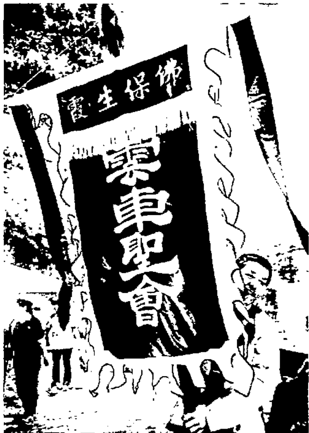
“佛保生霞云车圣会”会旗

膜拜空间是供奉神祇偶像、供香客祈福纳祥的场所,是整个庙宇的中心,也是庙会活动以及重要仪式举行的核心场所。妙峰山依山取势、高低有致地坐落着 14 座寺宇殿堂,分别供奉着道、释、儒、俗等各路神灵,自明朝就吸引着无数善男信女前往禳灾祈福、还香许愿。