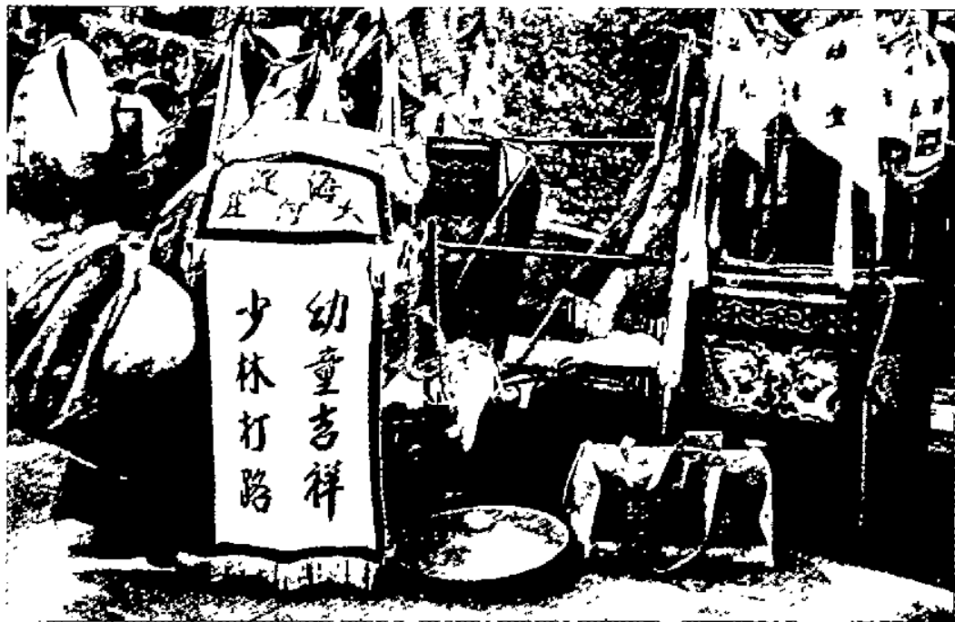
“幼童吉祥少林打路”武会表演械具

历史上妙峰山庙会兴盛时期花会组织每年多达400档。顾颉刚先生1925年通过统计会启明确当年朝顶花会组织99档,推断包括未贴会启的花会总数可达300余档,并根据花会会万儿(会名)中“老会”与“圣会”的区别(圣会百年以上称“老会”)统计出23个老会活跃如往。 ⑤