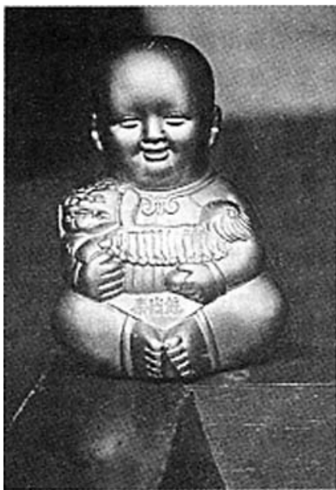
石膏模制的泰山娃

我在半山腰的斗母宫里,看见送子奶奶的神案上摆放着许多泰山娃。而在南天门的碧霞祠里,还遇到了一位正在