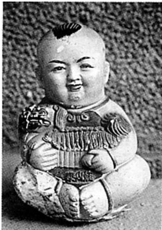
泥塑彩绘泰山娃(民国)

后来，利用去泰山开会的机会，我问过许多朋友，也去了泰山各处的旅游工艺品市场，甚至花了四个多小时从红门一直登上泰山极顶，逐庙逐店地搜寻，都没有找到那样的泰山娃。但也不能说一无所获。山路两旁，稍大点的店铺皆有泰山娃可买，三块钱一个，由石膏模制而成，个头略小，通身刷金，形状则完全相同，虽少了些沉稳和厚重，倒也不失童趣。中天门附近的一家铺子里，还有卖彩绘瓷制的泰山娃和泰