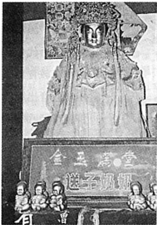
泰山斗母宫内的送子奶奶

可以看出，泰山的拴子习俗还相当流行。我一直认为民俗与民间工艺品是皮和毛的关系。民俗尚存，它所需要的民间工艺品就有市场，就会存在下去，尽管由于人们的眼光变化或者民间艺人的急功好利会使其在材料和工艺上有所改变，就像泰山娃一样，从泥制变成石膏制和瓷制。记得