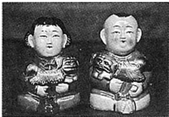
瓷制泰山娃、泰山嫚