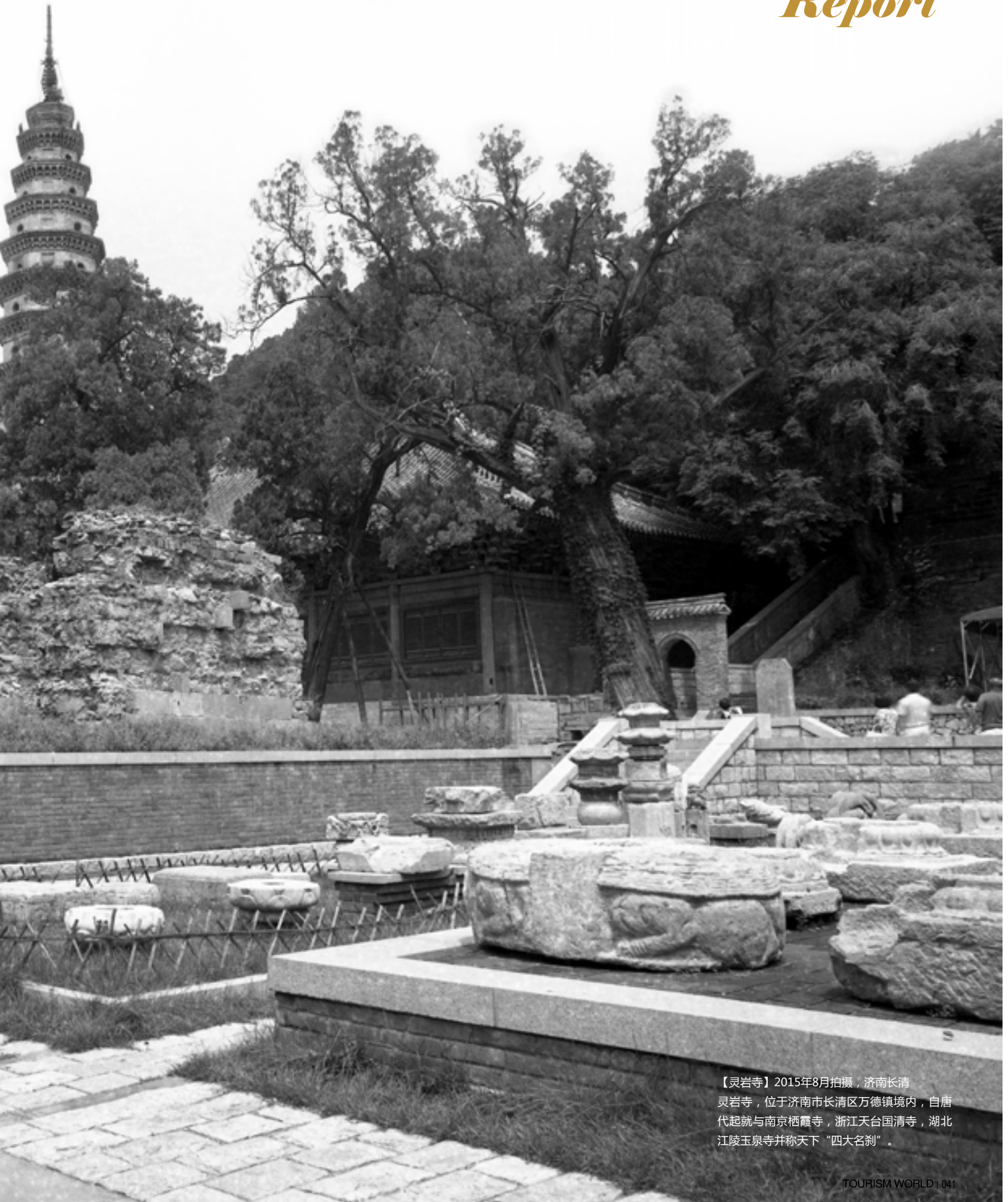
【灵岩寺】2015年8月拍摄，济南长清 灵岩寺，位于济南市长清区万德镇境内，自唐代起就与南京栖霞寺，浙江天台国清寺，湖北江陵玉泉寺并称天下“四大名刹”。