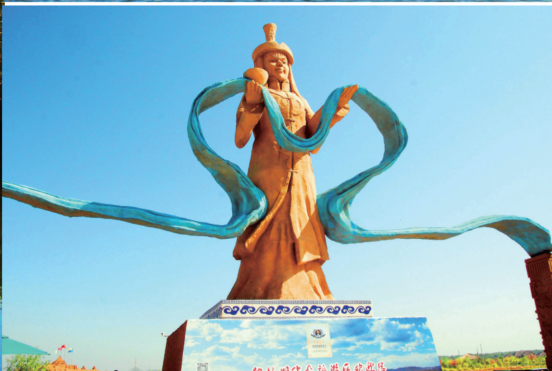
>> 上：纳林湖上的水上漂移 下：纳林湖门首的王昭君沙雕像

霸天下情景的一组沙雕。当年成吉思汗和他的儿子们一直打到欧洲多瑙河沿岸，大致到了现在奥地利的维也纳。所以当时的蒙古军队以及曾经匈奴王阿提拉都被欧洲人称为“上帝之鞭”，就是说欧洲人觉得他们是上帝派来惩罚他们的。