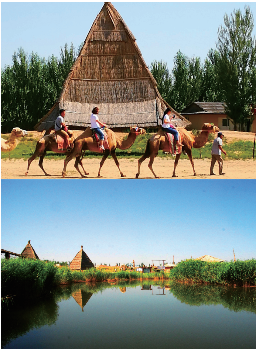
>> 上：纳林湖沙岛上的骑骆驼 下：纳林湖湖畔景观

天下黄河九十九道弯，在最大的几字弯头镶嵌着一个熠熠生辉的旅游新天地，这就是秦汉古郡、河套源头、百湖之县、蜜瓜之乡——磴口县。