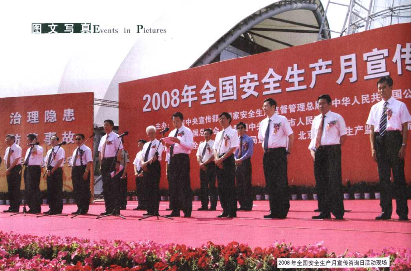
2008年全国安全生产月宣传咨询日活动现场