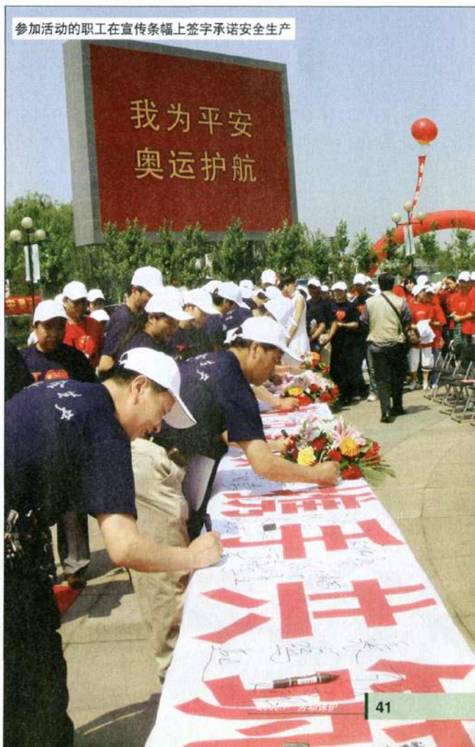
参加活动的职工在宣传条幅上签字承诺安全生产