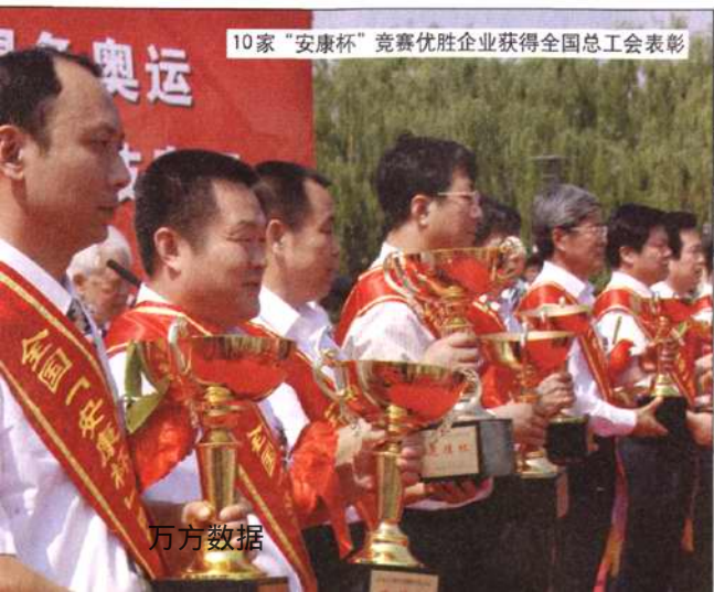
10家“安康杯”竞赛优胜企业获得全国总工会表彰