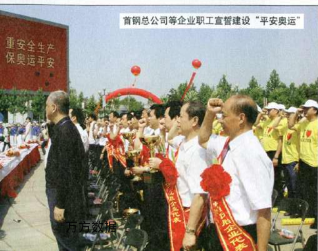
首钢总公司等企业职工宣誓建设“平安奥运”