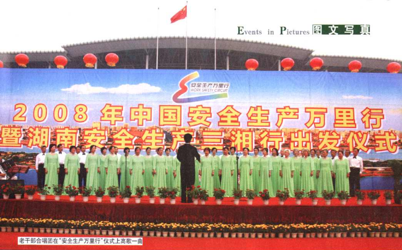
老干部合唱团在“安全生产万里行”仪式上高歌一曲