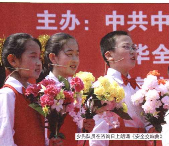
少先队员在咨询日上朗诵《安全交响曲》