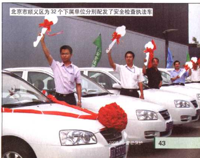
北京市顺义区为32个下属单位分别配发了安全检查执法车