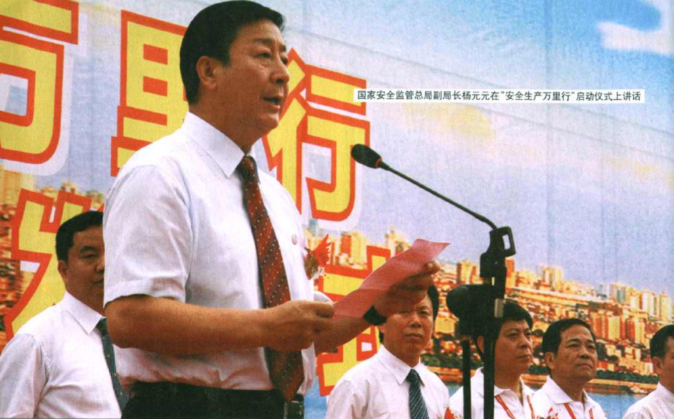
国家安监总局副局长杨元元在“安全生产万里行”启动仪式上讲话

咨询日当天，北京市各区县安监局围绕“治理隐患、防范事故——携手共筑奥运平安”这一主题，开展了形式多样、丰富多彩的宣传活动。丰台区各相关职能部门走上街头，向群众广泛宣传了交通、建筑、消防等安全生产知识和法律法规；顺义区为32个下属单位分别配发了安全检查执法车；通州区举办了第三届“安全文化节”