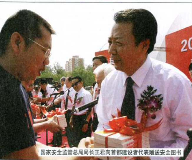
国家安监总局局长王君向首都建设者代表赠送安全图书