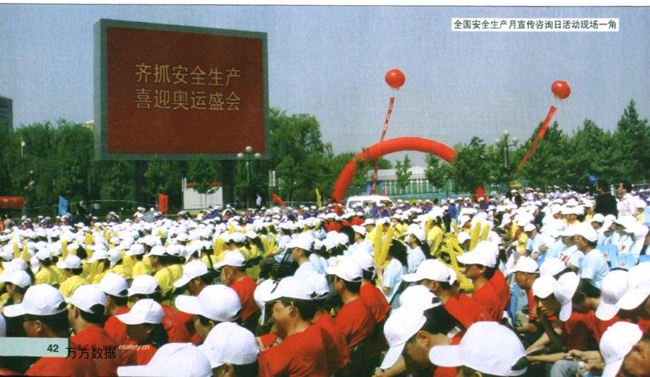
全国安全生产月宣传咨询日活动现场一角