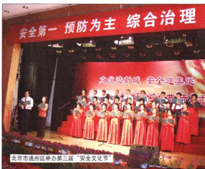
北京市通州区举办第三届“安全文化节”