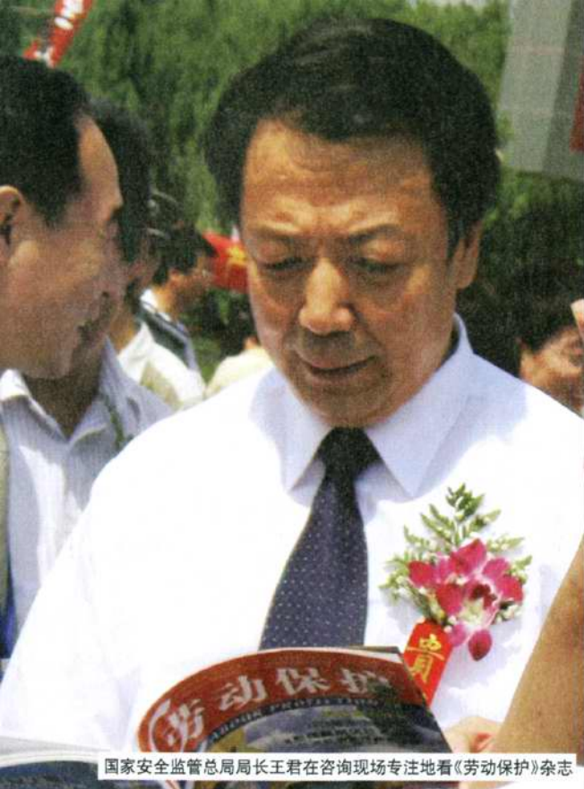
国家安监总局局长王君在咨询现场专注地看《劳动保护》杂志