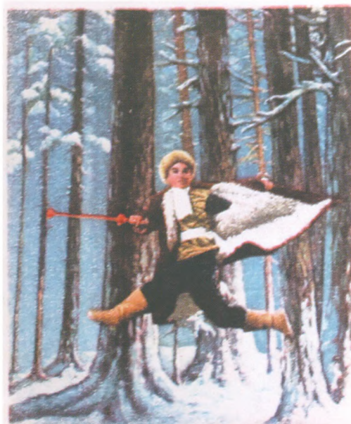
革命现代京剧《智取威虎山》