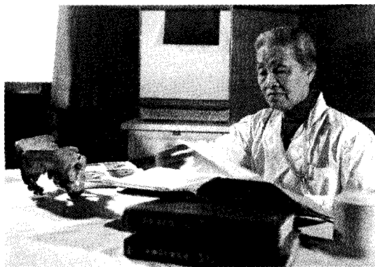
● 林巧稚在进行医学研究工作

编后： 1919年9月，协和预科向女生敞开大门；一年后，专门招收女生的协和护校成立。这两项举措在当时都是破天荒的大事，协和成为中国第一所男女合校的医学院。20世纪上半叶，职业女性崭露头角，却仍备受歧视。协和以开放的心态接纳了女性，也为她们设置了一道不尽人情的门坎：担任住院医生的女性，一旦结婚自动解聘，女护士如果结婚必须辞职。