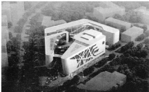
朵云轩艺术中心与上海京剧院迁建工程鸟瞰

在今天现代建筑表现方式是多元的,只要主题鲜明,通过运用局部的元素加以丰富,这样的建筑元素就到位了。