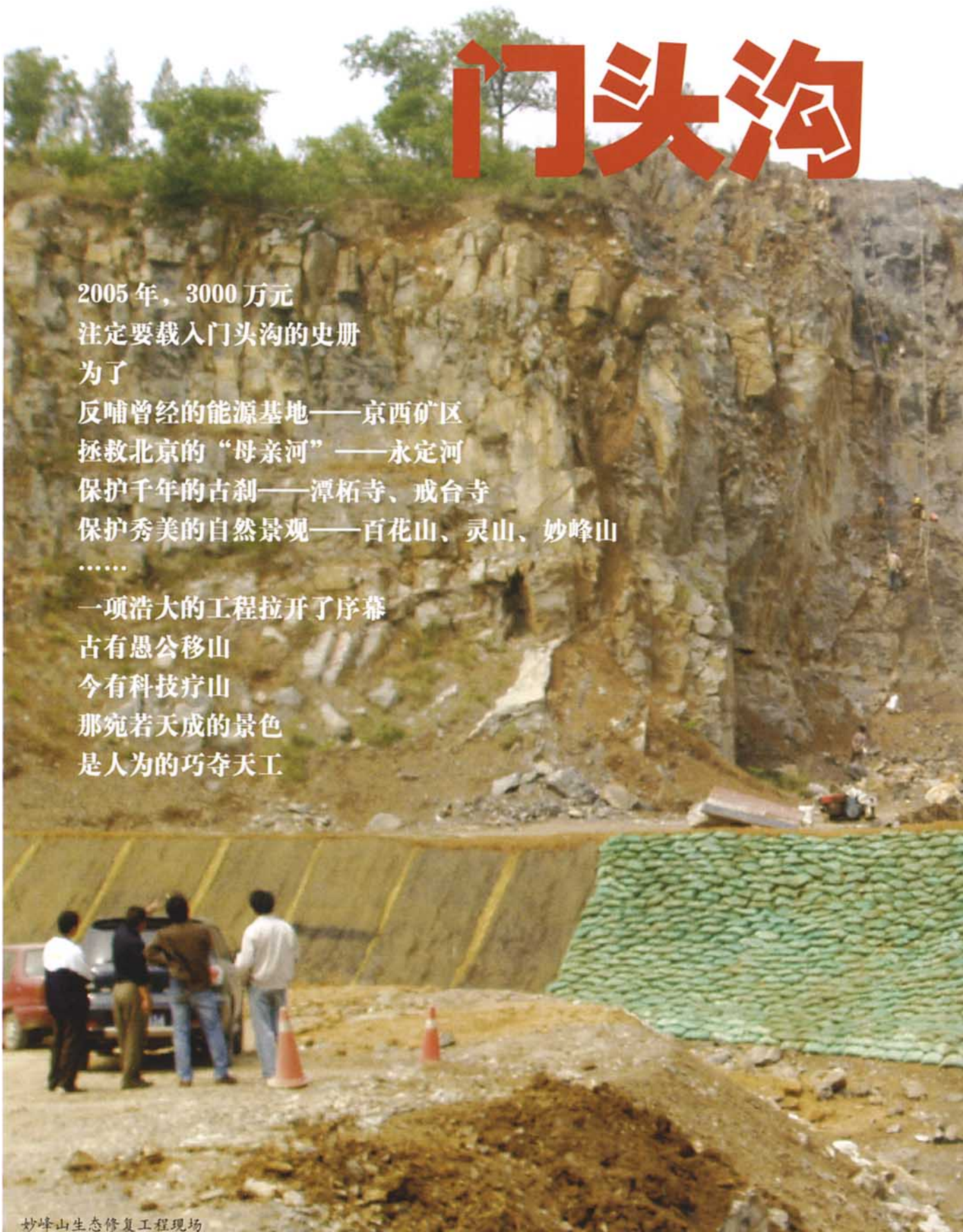
妙峰山生态修复工程现场

一项浩大的工程拉开了序幕 古有愚公移山 今有科技疗山 那宛若天成的景色 是人为的巧夺天工