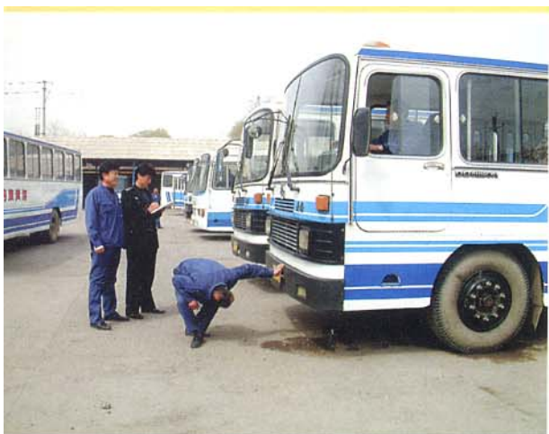
收车后对车况再次逐项检查