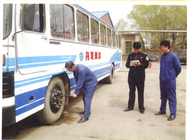
出车前认真检查车况