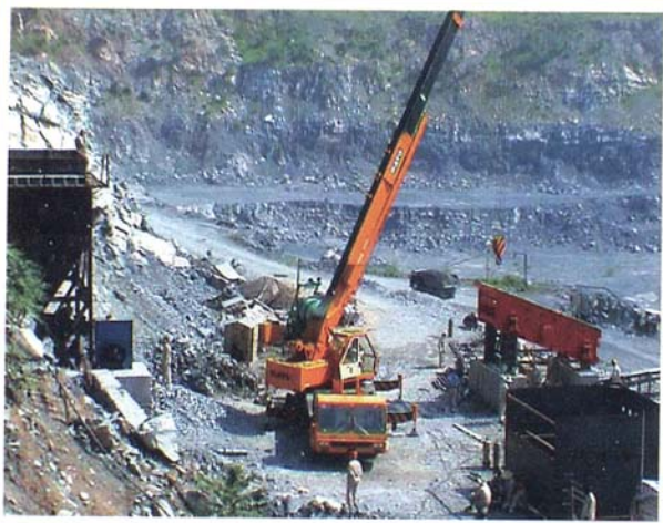
公司设备矿山之上显神通