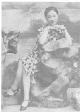
图3 30年代旗袍,高跟鞋必不可少

为更清楚了解老照片中上海30年代的旗袍,本文将这个时期老照片的旗袍样式作细致的分析研究。