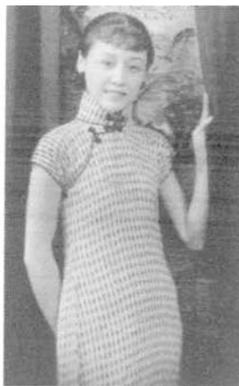
图4 穿条格旗袍的女子

照片分析:图4中女子身穿一款条格纹样的短袖旗袍,这种条格织物的旗袍在20世纪30年代前期、中期很时髦。此时旗袍袖子已经变得很短,领子较高,领口的两粒盘扣为素雅