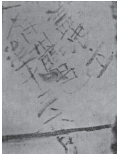
图 2 罗汉像体内墨书题记

由碑文记载可知，宋代的灵岩寺内确有五百罗汉像。但是，此五百罗汉皆为小型木雕，表面有明金贴饰，而非现存大型的彩塑罗汉像。碑文所载五百罗汉塑造的时间与大村西崖等专家所说的时间一致，但材质和体量却大相径庭。此碑文充分论证了千佛殿中四十尊彩色泥塑罗汉像与灵岩寺五百罗汉像无关。