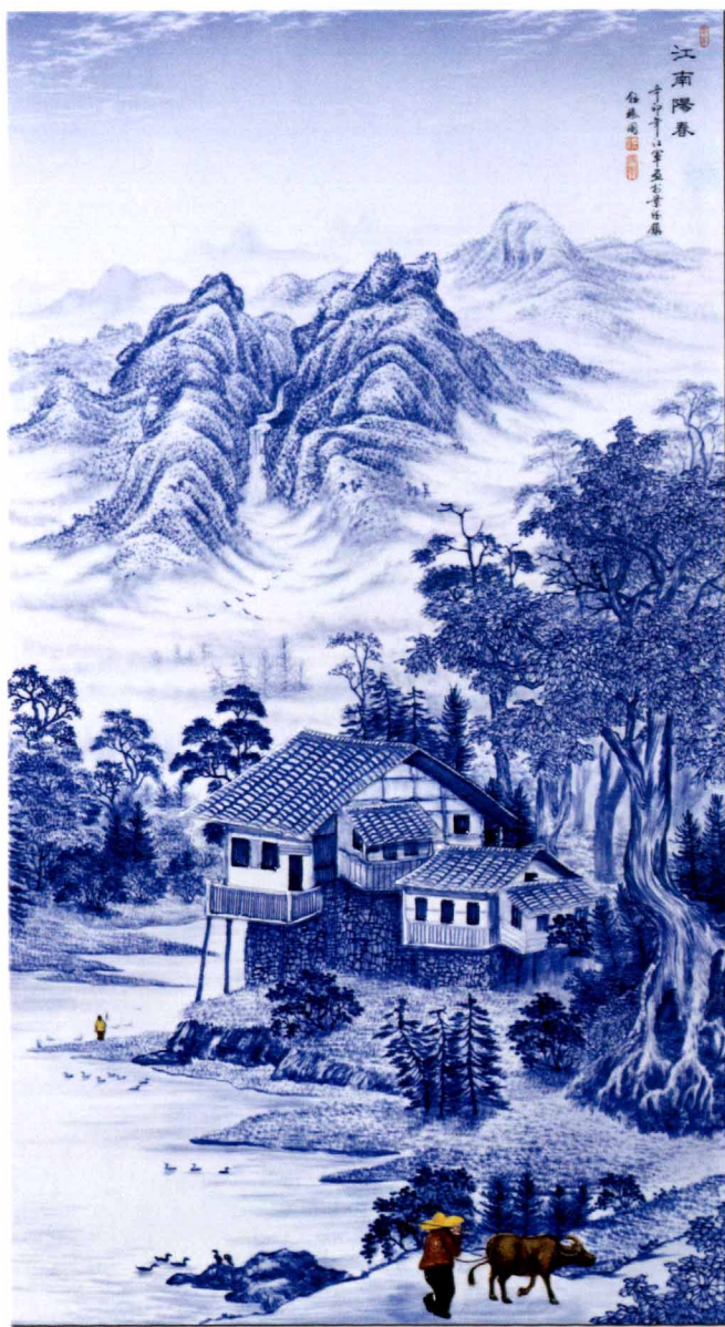
2尺6瓷板《江南阳春系列》

我从事陶瓷雕刻十多年，潜心研究，不为名利，只为创作出更多好的雕刻作品，也只有高端的示范作品，才有极强的说服力。我们艺术家是国家培养出来的，现在报效祖国是天经地义的事情，我将用实际行动去为国家尽点微薄之力。我将用我的一生去研究、发展、完善陶瓷雕刻这项传统技艺，用现代审美情趣和文化创意理念，去发掘传统技法的精华，去创作更多、更好、更新、更美的陶瓷雕刻艺术作品，这是我在生活中的一大乐事，也算是为弘扬景德镇陶瓷文化、保存景德镇陶瓷传统技艺做了一点自己应该做的事情吧。