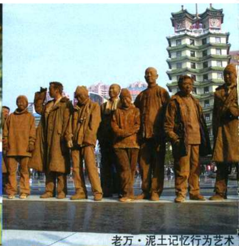
老万·泥土记忆行为艺术