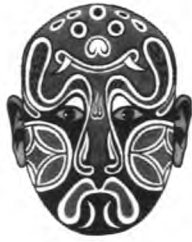
图4 金钱豹(付德威谱式)

抹脸,又称粉脸。是先用白粉将脸部涂抹一层白色,再用毛笔蘸颜料勾描出五官轮廓和面部肌肉纹理的化妆方法。白粉为底色,涵义为此类人物奸诈虚伪,不以真面目示人。多用于奸恶的角色形象,是一种饰伪性脸谱。如:三国故事《击鼓骂曹》中韩金福流派的曹操脸谱(图5),在近乎整脸的白粉底层上,寥寥几笔勾描曲线,将曹操阴险毒辣的性格一面以形象的概括;《空城计》中侯喜瑞流派的司马懿脸谱(图6),很好体现出其诡计多端、阴险疑诈的性格特征。