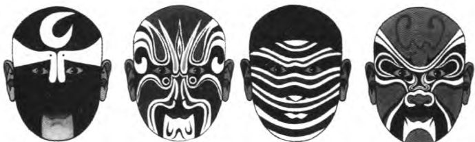
图9 包拯（高庆奎谱式）

份特征。如：神仙故事《蟠桃会》中的水怪脸谱，以整脸横向的，不同粗细的银色与蓝色间隔曲线，来凸显角色来源于的“水”中身份特征（图11）；西游记故事《水帘洞》中的牛魔王形象，面部以金色为基调表明其神怪身份，再以白色块面为辅，用红色喝黑色勾线点缀（图12）；