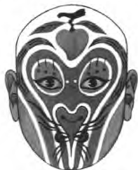
图3 孙悟空(侯喜瑞谱式)

事《闹天宫》中的孙悟空脸谱(图3),演员面部的猴脸形象与其前额部的蟠桃形象均为勾绘涂染出来的效果;与西游记相关的《金钱豹》故事中付德威流派的妖魔金钱豹脸谱(图4),演员以贴金为基色,脑门上以点、线勾出豹子的眼睛、鼻头、獠牙、豹纹斑等图案花纹,两侧面颊上以线勾描出方孔金钱的图案,鼻根上以线勾描火焰纹,以具体的图像象征凶猛妖花的金钱豹形象。