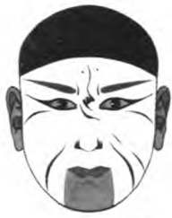
图6 司马懿(侯喜瑞谱式)

破脸,又称歪脸。京剧脸谱一般眉、目、面纹左右对称,破脸主要指面部左右两边图形明显不对称的脸谱。通常含有贬义的指向,表示角色及其丑陋或品质恶劣、性情凶残,是对人物形象或性格有意地夸张凸显。如:关于宋王赵匡胤故事《斩黄袍》中的郑子明,以破脸的形式表现他传说中相貌丑陋,性情凶猛的特征(图7);施公案故事《恶虎村》中的楞儿脸谱(图8),红白两个块面将面部斜向划分,传达出人物的险恶无赖等形象特征。