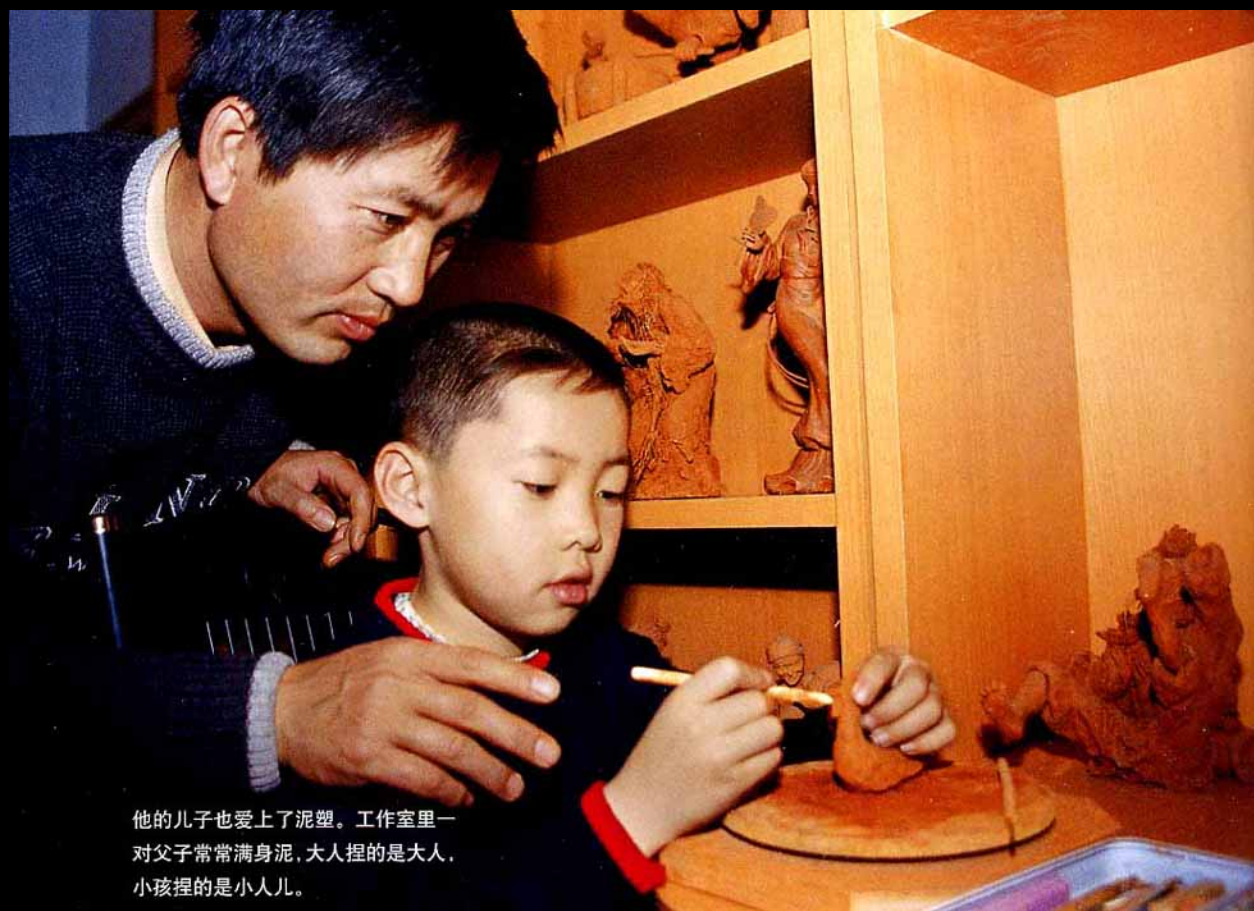
他的儿子也爱上了泥塑。工作室里一对父子常常满身泥，大人捏的是大人，小孩捏的是小人儿。

很怀旧，听说任健是为了再现旧街的风貌都愿意帮助他，若老人自己不知道还特地带着任健去寻访知根底的其他老人。