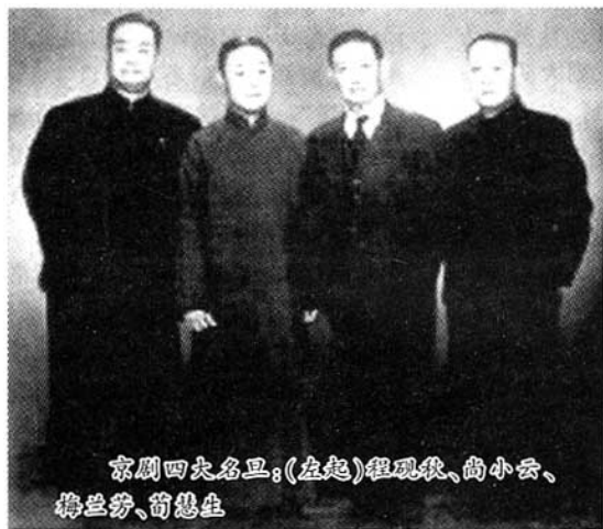
京剧四大名旦:(左起)程砚秋、尚小云、梅兰芳、荀慧生

从此以后,陈墨香与荀慧生的合作一发而不可收。继上演《全本玉堂春》之后,陈墨香又相继编出《女儿国》、《钗头凤》、《红楼二尤》、《美人一丈青》、《荀灌娘》、《孔雀东南飞》、《鱼藻宫》等多部剧本,这些剧本绝大部分交由王瑶卿、荀慧生演出。为了更好地合作,陈墨香介绍荀慧生入王瑶卿之门深造,同他主持拜师礼;荀慧生也请王瑶卿主持,特聘请陈墨香到自己家里设馆编戏,并师之以礼,使合作更加紧密。当时,陈墨香住京城椿树胡同上二条,荀慧生住椿树胡同上三条,两家相距甚近。陈墨香每天下午到荀慧生家,与荀慧生“抵掌谈艺”,切磋剧本。荀慧生在谈起二人的合