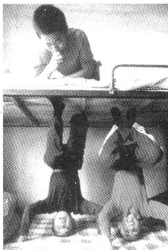
在宿舍里也不忘练功。