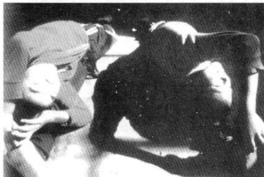
压腿,是孩子们每日必修的功课。