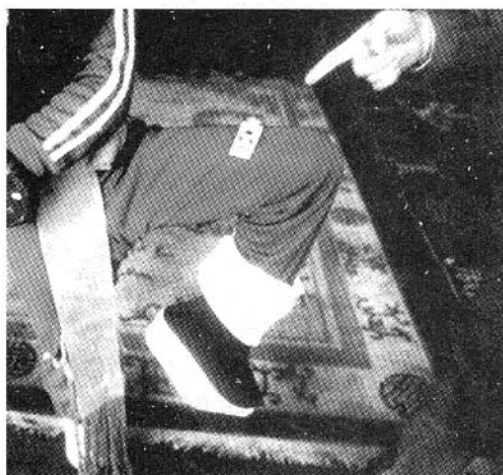
老师把钥匙串放在孩子抬起的腿上,训练他的平衡能力。