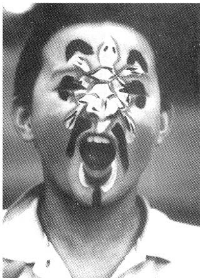
小演员脸上勾好了乌龟图案,他将在一出武戏中扮演水族一员。