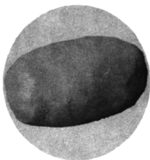
一、捏出长圆形牛身