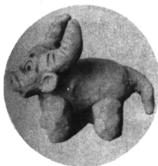
七、捏上牛尾巴后就完成了