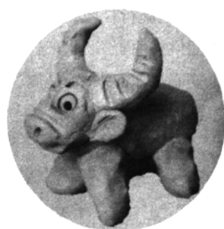
六、搓出四段圆柱形泥条做牛腿