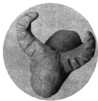
三、捏出牛角,用工具压画出角纹