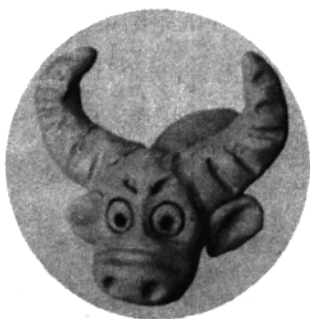
五、用工具扎出牛的眼、鼻、嘴