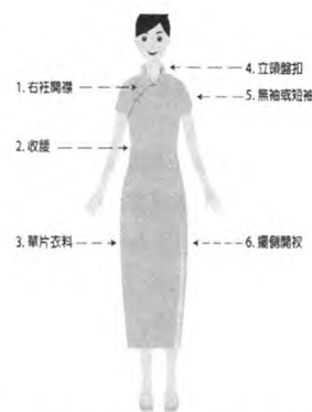
图2 现代旗袍(改良旗袍)款式特征