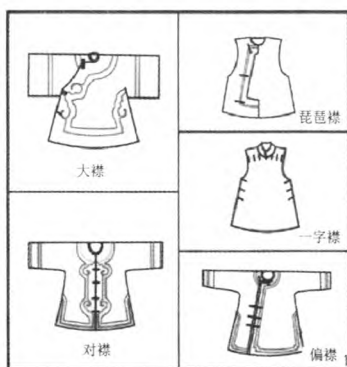
图3 传统袍服轮廓示意图