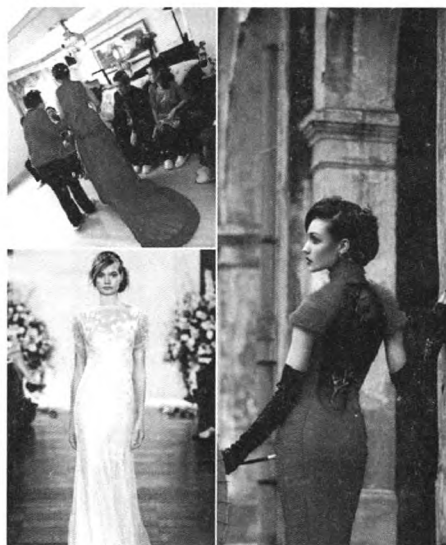
图6 新款旗袍的变化发展

旗袍它既有沧桑变幻的过往,更拥有着焕然一新的现在。伴随着时代的变化发展,现代的服装设计师又逐渐赋予旗袍很多新的时代特征,使之随着时代的发展焕发出新的生命力。我们可以发现许多国际设计师的服装中运用到了旗袍的元素,但不在局限于固定的细节,而是有了很多新的元素运用,比如蕾丝面料的使