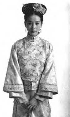
图4 传统旗袍典型款式

从以上两个结构图的对比中,我们不难发现,传统的古代的袍服(包括旗袍的早期)其制图中主要是外轮廓的变化,比如旗袍袖子的肥瘦,衣服下摆的宽窄,而其服装内部是没有任何分割线变化的,这是典型的中式服装制图,不论各朝各代的服装,都没有离开这一形式。成品服装上我们可以发现,这类传统袍服的袖子是没有设计肩缝的,大身和袖子是连裁,腋下一般都会淤积较多的褶皱。而改良的旗袍,却完全脱离了这类典型的制衣做法,从结构图(图1)上可以清楚看到,不管是长袖旗袍还是短袖旗袍,改良旗袍袖子和身都是分开裁剪的,袖山和袖笼的弧线缝合,很好的解决了腋下面料淤积的问题。衣片中也有了菱形的腰省设计,这一结构使得成型后的旗袍更具有曲线。