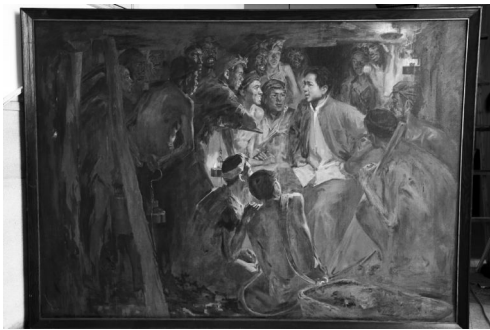
油画《毛主席和安源工人在一起》