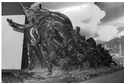
群雕石膏像《进军井冈山》侧面