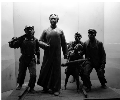
《红太阳照亮安源山》石膏雕塑