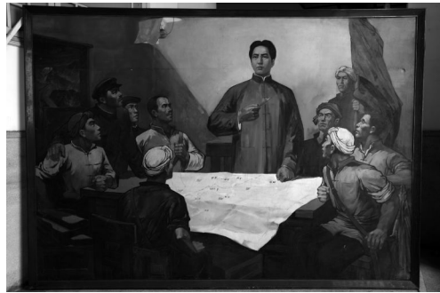
油画《安源军事会议》