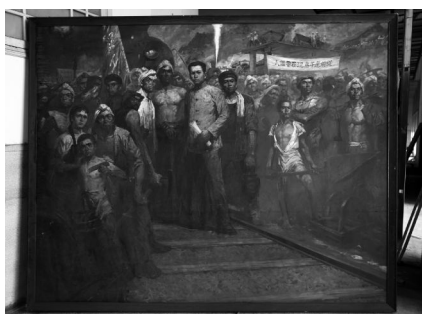
油画《刘少奇和安源矿工》