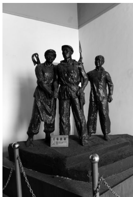
石膏雕塑《工农联盟》