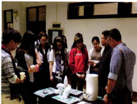
▲香港中文大学师生参观课程成果展2013年11月2日

广州美术学院雕塑系“泡沫”减法切割在抽象雕塑课程教学中的运用，经过笔者六年的教学实践，教学大纲、教案不断修改、不断提升，目前已经逐渐形成“抽象雕塑”教学体系。