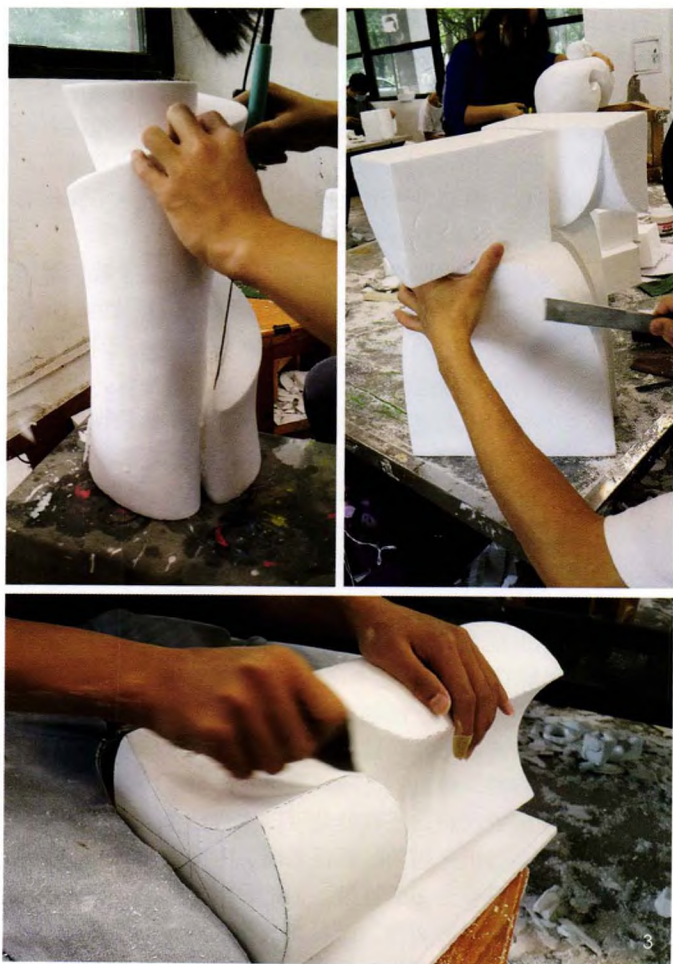
2. 材料与工具 (图5)