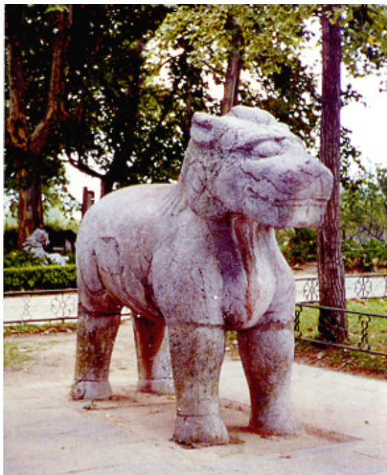
明·明孝陵石雕狮子 江苏南京