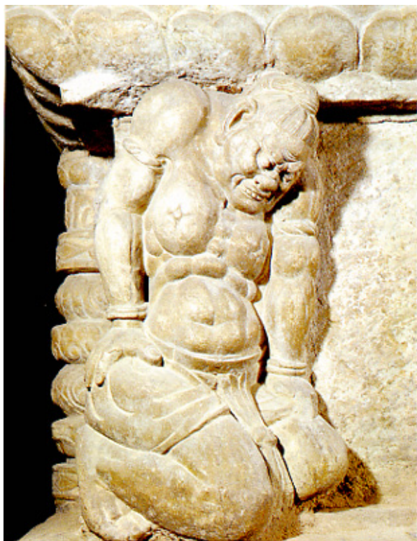
石雕力士 河北正定