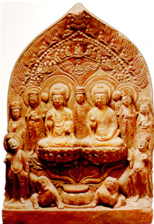
南朝·释迦牟尼多宝石造像 四川成都