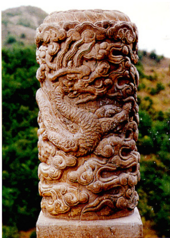
清·石雕云龙纹望柱 河北承德