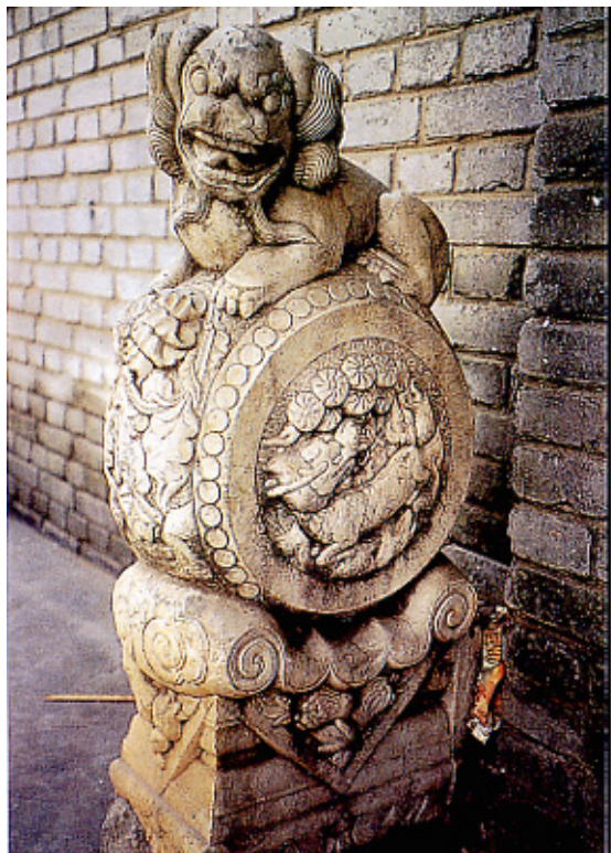
清·石雕鼓形门墩 北京