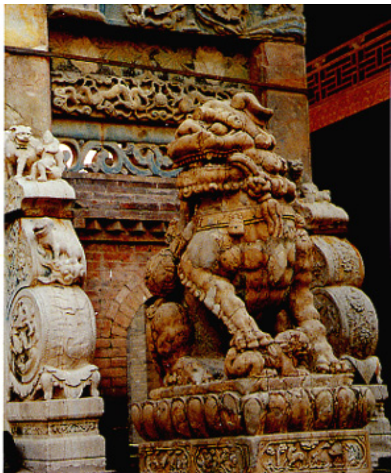
清·石雕狮子、石枋局部 山西运城