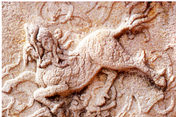
石雕麒麟照壁 广东广州