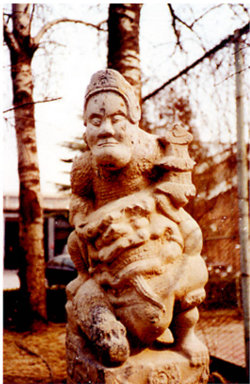
石雕拴马桩 陕西渭南

中岳庙与山东曲阜鲁王墓前的石人，四川灌县出土的李冰石雕像与四川雅安高颐墓前的翼兽，以及河南洛阳伊川和陕西咸阳出土的石辟邪，造型简括拙朴，格调豪迈挺拔，标志着汉代雕刻技艺已高度成熟。平雕，即平面浮雕，有平面阴刻、平面阳刻等几种形式。东汉墓室、祠堂等建筑的石壁上盛行这种平面浮雕装饰，内容有历史人物、神仙故事、社会生产和生活等。由于多为浅浮雕，起伏不很明显，因此又被称为“石刻画”或“画像石”。画像石是我国一项丰富的艺术遗产，从汉魏至隋唐一直盛行，山东、河南、四川、江苏、陕西等地都有大量遗物出土。比较著名的有山东嘉祥宋山、济宁两城山、临沂沂南画像石，河南南阳画像石，江苏徐州画像石和陕北绥德画像石等。三国、两晋、南北朝时期，除佛教造像盛行外，碑塔、窟龕、陵墓石雕也有很高成就。护墓石兽多为天禄(天鹿)、麒麟和辟邪。天禄或麒麟有角，一般立于帝王陵前；辟邪无角有翼，大多立于贵族墓前。魏晋南北朝的建筑装饰，特别是千变万化的佛龕布局和龕楣装饰，充分发挥了这一时期工匠们的聪明才智。在云冈、龙门、巩县、响堂山石窟的装饰雕刻中，从地面到天花，从背光到龕楣无不显示出装饰纹样的绚丽多彩。