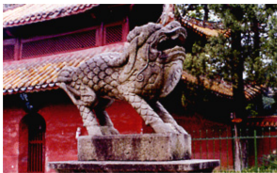
石雕麒麟送子 甘肃庆阳

清代民间比较著名的石雕有青田石雕、寿山石雕、菊花石雕、曲阳石雕、惠安石雕和云南大理石雕等。青田石雕产于浙江青田，相传创始于南宋，最初是刻制印章，以后品种逐渐增多，有各种实用品及山水、花卉、佛像等欣赏品。清代极为流行，传统产品以“葡萄山”