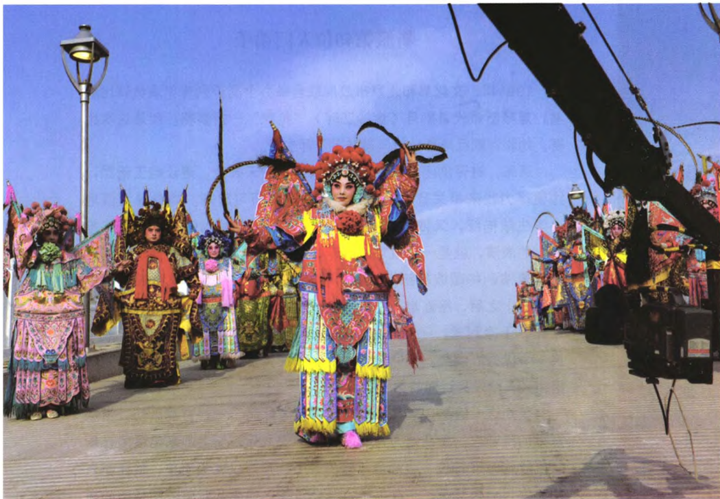
拍摄评剧艺术节主题歌《中国评剧》