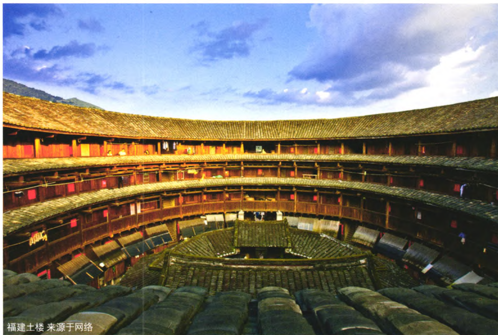
福建土楼