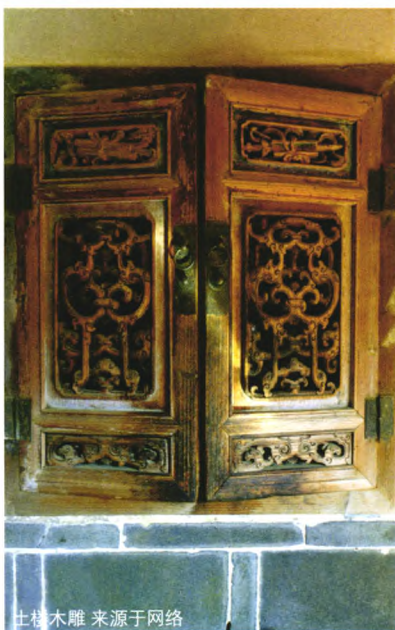
土楼木雕

木雕多施于轩、门罩、隔扇、门窗，厅堂门上方的檐间等处，雕饰纹饰，繁富多彩，皆不重样。土楼内屏门的各色木雕各具特色，在主厅堂屏门上方，用多漆金木雕。振成楼楼后的厅堂两侧，以木雕雕饰手法，镌刻一幅对联：“振作哪有闲时少时壮时老年时时努力，成名原非易事家事国事天下事事事关心”，赞叹楼主修养境界的同时，观者也被镂永的木刻艺术所折服。承启楼内珍藏的艺术珍品——楠木寿屏，在乾隆十九年（1754年），为承启楼创建者江集成的次子——江建镛京城尚书，在其七旬大寿寿辰时，为大学士所赠。该寿屏由12块楠木板连接组成，寿屏近15.03平方米的雕饰面积，寿屏正面中间处雕刻《郭子仪拜寿图》图饰，寿屏上下雕有