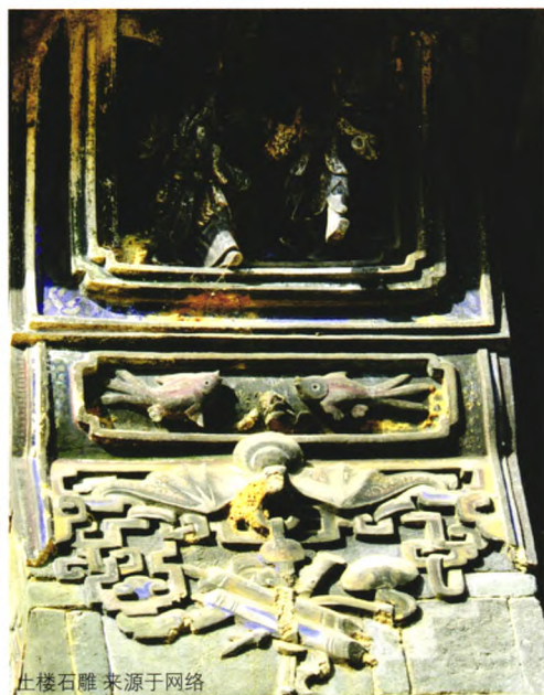
土楼石雕

《二十四孝图》以及《四季图》图饰，上至三公九卿、文武百官，下至凡夫俗子、平民百姓，凡187人，惟妙惟肖，呼之欲出。如此高超精湛的雕刻工艺、历久弥新的艺术魅力令人屏息敛气，叹为观止 [4] 。