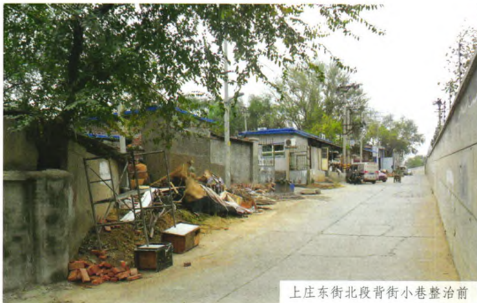
上庄东街北段背街小巷整治前