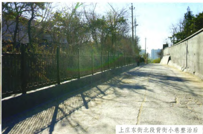
上庄东街北段背街小巷整治后