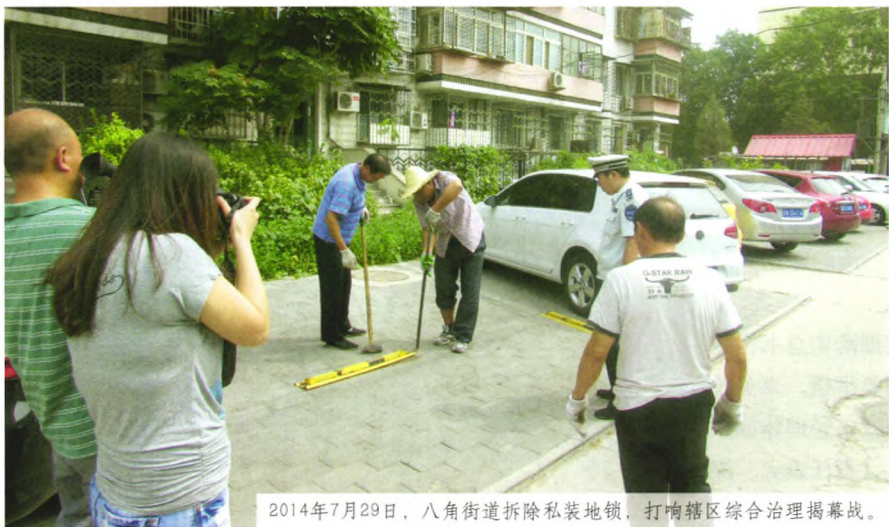
2014年7月29日，八角街道拆除私装地锁，打响辖区综合治理揭幕战。