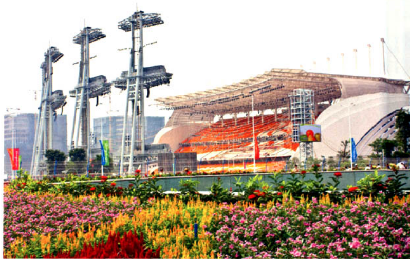
亚运开幕式主场

为营造整洁的市容市貌环境,广州市全力开展了对违法广告设置和过期户外广告牌匾的整治清拆行动。截至2010年10月底,广州市共拆除违法户外广告21737宗、26682块,面积达415633