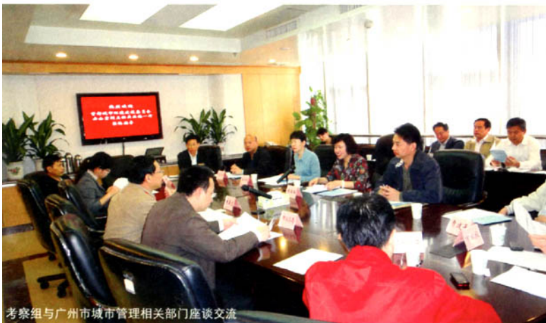
考察组与广州市城市管理相关部门座谈交流

广州市高度重视城市环境建设及管理,始终把加强城市环境建设作为推进城市现代化、提升城市竞争力的根本动力,明确提出以亚运为契机,努力打造“天更蓝、水更清、路更畅、房更靓、城更美”的“大变”工作目标和“以大干促大变迎亚运”的工作要求,