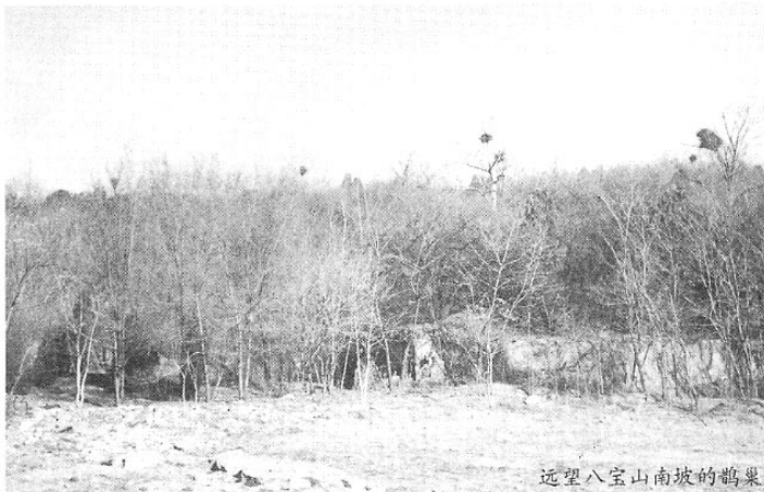
远望八宝山南坡的鹊巢