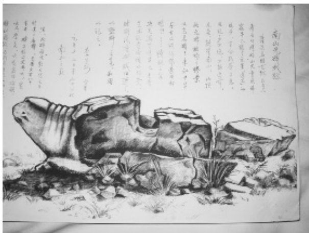
文革中被砸毁的唐帝庙碑写生图

《帝王世纪》载“汉出自帝尧,刘姓也。”汉朝皇帝家室都自称是尧的后代,所以奉祀尧帝始于西汉,有记于东汉。西汉在尧山建祠庙以奉帝尧,到了东汉灵帝时在祠前立尧庙碑记以奉祀。伴随朝代兴衰更迭,尧祠饱经沧桑,几经荒废。到了元代大德元年(1297年)唐帝庙建于尧山主峰(南山)上,翰林侍读大学士郝经撰写碑铭的《唐帝庙碑》竖立于庙殿之前,碑分碑身和碑座两部分,通高7.10米。其中碑身高5.30米,宽1.90米,厚0.63米。碑首六龙盘顶,碑额