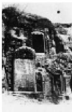
上为多心经石室, 下为没影碑

尧山主峰尧帝庙东南30米处,依山阴刻“南无阿弥陀佛”六个大字,当地俗称大无影碑。在尧帝庙西南约400米处,原建有龙王庙。庙废后留有庙前影壁石,上刻浮雕卧麒麟,左刻有山石,上刻有卷云纹,周饰花卉。壁石东有两通摩崖碑刻,一是明万历年间《龙王祠碑》,一是民国年间《重修龙王庙碑》,当地人称二碑为小无影碑。