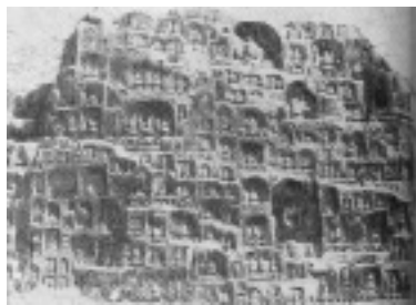
被毁前的摩崖造像

释迦牟尼涅槃像又称卧佛像或者睡佛像,在千佛殿南面偏西,“头向南,长5米。背靠悬崖,依山雕成,都说是为了保护行人安全雕的”。 ② 虽经千年风雨,但仍可从当时的照片上看出其面部和衣纹清晰优美。