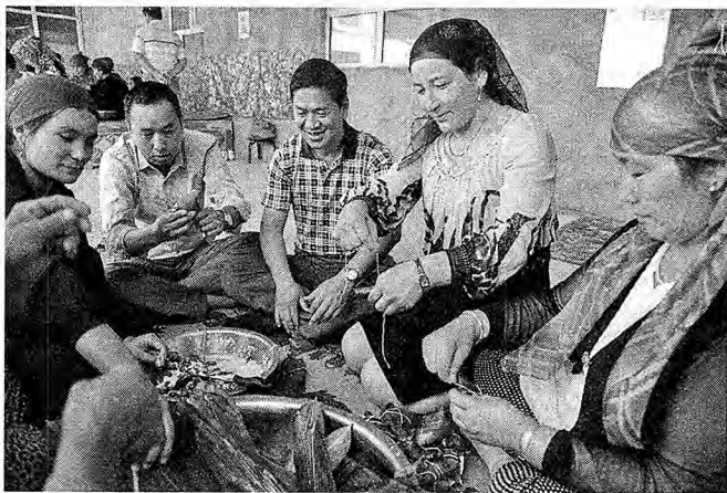
6月17日,兵团党委宣传部住三师五十三团三连“访惠聚”工作组和三连的职工群众一起参与“粽情端午”包粽子比赛。