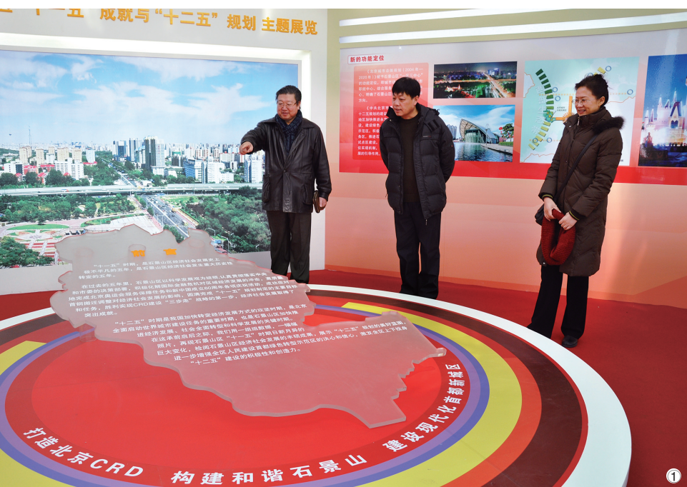
① 打造北京CRD 构建和谐石景山