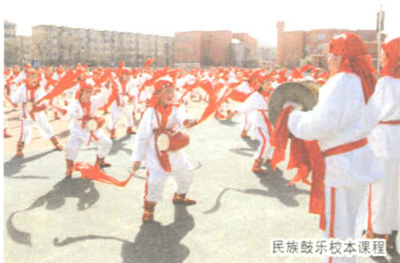
民族鼓乐校本课程

我区以科学质量观为指导,出台《中小学教学质量管理和监控实施意见》、《石景山区小学教学质量全面管理手册》,形成从小学到高中的分学期和分学段的监测与分析机制,行政、科研、教研、督导协同落实。全区各中小学校建立教学质量监控中心,依据学校质量管理规范与流程,加强对教学各环节的监控指导力度。我区坚持教学视导制度,每学期对近10所中小学进行专题或常规视导,帮助学校查找问题,改进教育教学工作。为保证每一门课程的质量,促进学生全面健康发展,我区加大对音乐、体育、美术等学科的质量监测力度,并将测评结果纳入对学校的综合评价