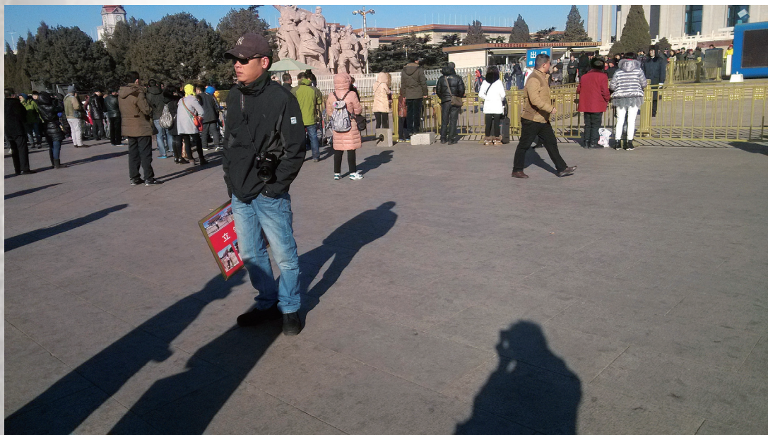
“天安门经济”在整个中国经济大潮中有着光鲜的一页