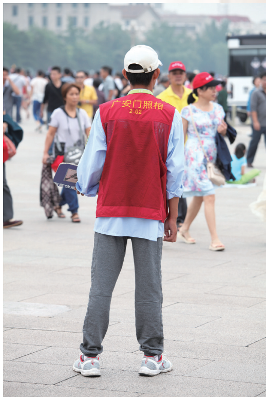
旅游景点随处可见这样的“摄影师”