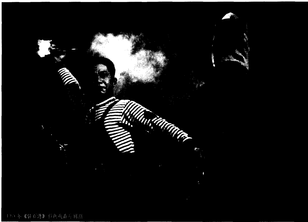
1971年《磐石湾》彩色戏曲片剧照