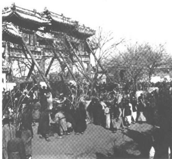
1909年白云观春节庙会。白云观是北京最大的道观，位于西便门外，创建于唐代开元二十七年（739年）。金大定七年（1167年）重建，后改名太极宫。明初正统年间，改名为白云观，沿用至今。老北京的每年正月初一到十九，白云观都要举办与宗教信仰有关的活动，逐渐形成白云观春节庙会。