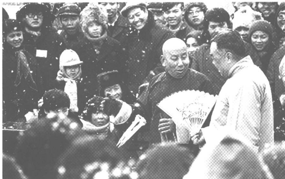
1985年2月，东城区创办了第一届“地坛文化庙会”，北京人的经济文化生活又恢复了沉寂多年的活力

厂甸庙会(1963年)是北京历史上八大庙会之一，也是这八大庙会中规模最大、最负盛名的一处。厂甸庙会起于明嘉靖年间，一直延续不断，如今已四百有余。历史上，与南京夫子庙、上海城隍庙、成都青羊宫并称为中国四大庙会。厂甸庙会一向以书籍古玩、字画文具独秀于林，自古便以“文市”著称。同时特色小吃、传统工艺、日用百货和儿童玩具也颇具盛名，逛庙会的人三教九流、士农工商无所不有，无论男女老少都能在此各得其乐，各有所获。