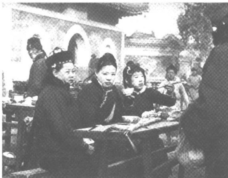
满族妇女在庙会上吃小吃。拍摄于上世纪20年代末

庙会是北京千百年来社会活动之一。庙会始于古代的“社祭”。社祭的时候，百戏杂陈，百货云集。有来看社祭（戏）的，有来看杂技的，有来买百货的，所以社祭又叫“社会”。社是什么？就是古代的土谷祠（土地庙），因此就有了“庙会”这个名称。北京的庙会，从地区上来分，可以分为城区和郊区；从性质上来分，可以分为定期集市、小型物资交流会、小型商品供应站和以进香敬神为主要目的的集会。