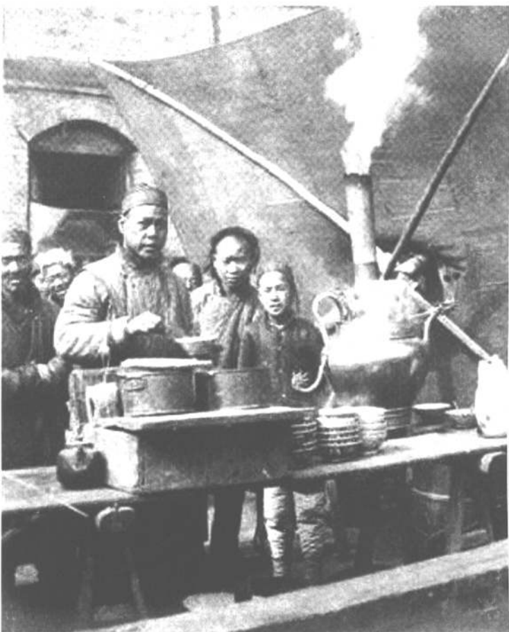
庙会上的小吃——冲茶汤。老北京庙会上，有灌肠、酿皮、豆汁、茶汤等30多种风味小吃

还有一类小型商品供应站式的庙会，大部分在郊区农村中，这类庙会和古代的社祭极相近，只是把烧香拜神“祭”的部分缩得很小，扩大了做生意和娱乐的幅度。北京这类庙会，解放以前有南郊的南顶庙、中顶庙，西郊的西顶庙，北郊的北顶庙，离丰台1里地的看丹庙。庙会时期，有赶庙做生意的，有表演杂技的，做生意的大部分卖农具，杈子、筛子、扫帚、锄板、木锨、铁锹等。这些庙会在上世纪20年代前后就停止了。北顶看丹村的看丹庙没香火，每年农历四月二十八日起举行3天庙会。解放后，政府把看丹的庙会组织起来了，各行生意，都一排一