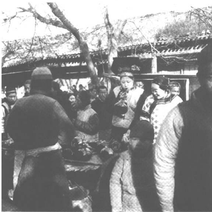
1909年的护国寺春节庙会。照片中的场景距现在100年了，似乎还有摊贩的叫卖声、买家的讨价还价声、各种玩意儿的碰撞声……在耳畔回响