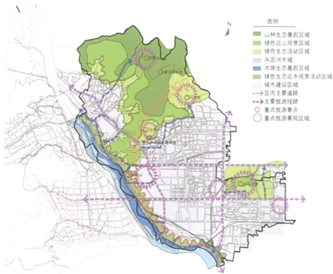
弯月型绿色生态景观建设带和东部绿洲

点是指社区公共空间、小型公园广场和块状绿化，如同细胞组织；线是指社区道路沿路不规则的公共空间和线型绿化，