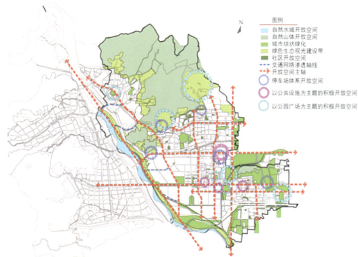
石景山区广义城市开放空间体系