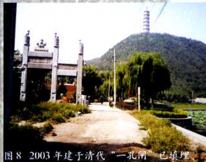
图8 2003年建于清代“一孔闸”已填埋

桥至玉泉山南门)为湖北边界,在北坞村路西侧恢复高水湖和湖心“影湖楼”,北坞村路东侧、昆明湖路北侧为湖西南边界,颐和园西墙外为湖东边界。