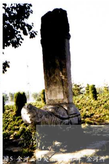
图5 金河山口处“石井”“金河碑”