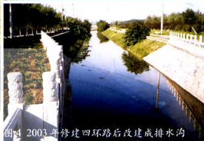
图4 2003年修建四环后改建成排水沟