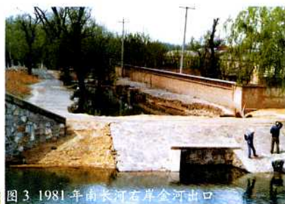
图3 1981年南长河右岸金河出口