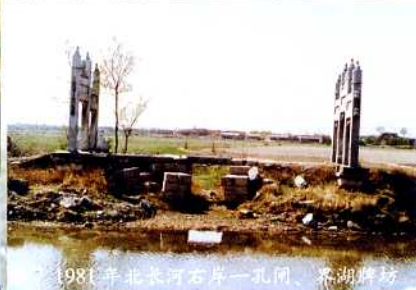
图6 20世纪60年代玉泉山下水田(原高水湖)