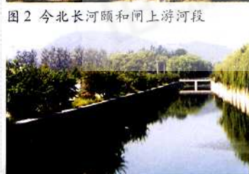
图2 今北长河颐和园上游河段