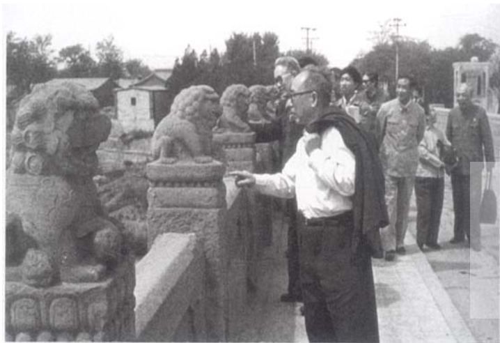
1985年6月，北京市政协与全国政协组成保护联合调查组，在卢沟桥进行实地考察

影响大，效果会更好。市政协的提议，得到了全国政协领导的支持。经过协商，很快成立了以全国政协常委、民盟中央副主席、全国政协副主席萨空了为组长，北京市政协委员、原北京市文化局副局长田兰为副组长的全国政协文化组、北京市政协文化组文物保护联合调查组。调查组成员还有“全国政协委员侯仁之、单士元、邵宇、郑孝夔、罗哲文，北京市政协委员张开济、方贤旭、赵东日、李杏村、陈鼎文、赵其昌等文物、历史建筑、环保、文艺等方面的专家、学者。