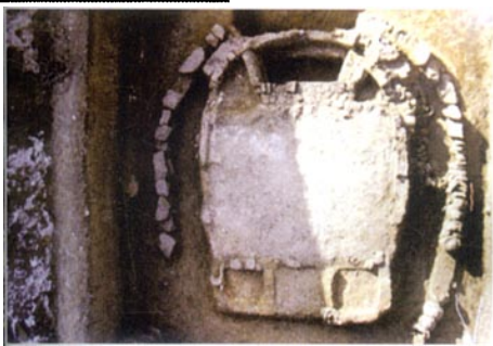
龙泉务辽代瓷窑遗址

年,初步形成了民俗商贸经济的格局。三家店村主要街道仍保留古朴风貌,近年来已引起众多专家的格外关注。村中古迹众多,区级文物保护单位就有7处:龙王庙、天利煤厂、中街59号院、东街78号院、山西会馆、白衣庵、二郎庙,另有铁锚寺、三官庙、树神庙、关帝庙等古迹,而且又是北京市级历史文化保护街区。因此,在开发三家店时应注意如何处理好保护和利用的关系,应恢复其历史原貌——商业街布局,并改为商业旅游步行街,恢复一些老字号和特色摊点;二是保护永定河资源与加快门头沟区经济发展的关系,首先进行沿河两岸的综合治理,取缔对环境有污染的企业,禁止在河边洗车,以保护永定河不受污染;三是开发永定河文化与保护历史遗存的关系,门头沟区是北京市的文物大区,有各级文物保护单位78处,地上地下文物丰富,但管理权、所有权归属太乱,属多头管理,如有的属国有、有的归村集体、有的归私人所有。应明确对文物保护单位的管理权和所有权,如有的虽属私人所有,但处于无人管理的应进行征购,有的虽属国有但却失于管理,也应收回归文物部门管理,以便于今后的开发利用。四是开发永定河文化资源与发展现代文化产业的关系,应利用对永定河文化开展研究的机遇,整合资源,开发出具有门头沟区特色的旅游纪念品系列,形成门头沟区旅游纪念品的文化