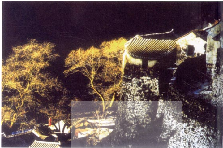
明清古村落——川底下

富提供门路。其五,进行社会学的研究,如在社会变迁的方面,重点在中国历史上几次大的变迁,对当地社会发展的影响与作用,特别是党的十一届三中全会以来,伴随中国改革开放大潮,当地政治、经济、群众生活、地方基本建设与文化教育、社会道德风尚等变迁、社会流动方面。从而了解一个地方维系社会发展的机制或限制发展的基因,了解这一地方以往发展或将来更大发展的条件与促进源,了解其有无特定的凝聚力或内部破坏因素,以及这些情况的成因与特点。永定河文化不是门头沟的土著文化,而是不同地域文化、不同民族文化交融所形成的一种文化形态,它突出体现了中华民族传统文化多元、和谐、共生的状态。永定河文化的形成是开放、交流和融合的结果,这是永定河文化形成的历史过程,也是永定河文化的理念。今天在严格保护的基础上开发利用,也应该继承这个理念。从旅游这个角度来说,特色是旅游之魂,而真正的特色是文化,文化是特色之基。要通过文化来提升商业价值,综合起来形成永定河文化旅游的大格局,作为总体的拳头产品,这样影响就出来了,拉动力就大了。