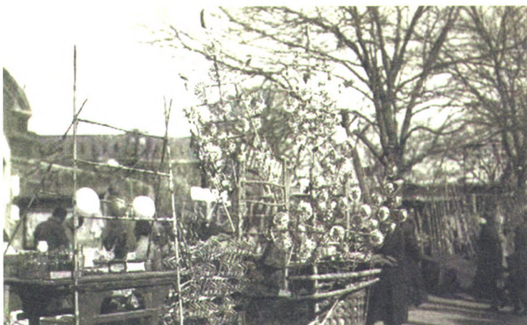
老北京厂甸庙会中的风车摊位

《1963年度厂甸春节市场工作小结》的档案中,对厂甸庙会的日期是这样注明的:庙会市场暂定15天(正月初一至十五)。视情况而定,延长或缩短庙会时间。