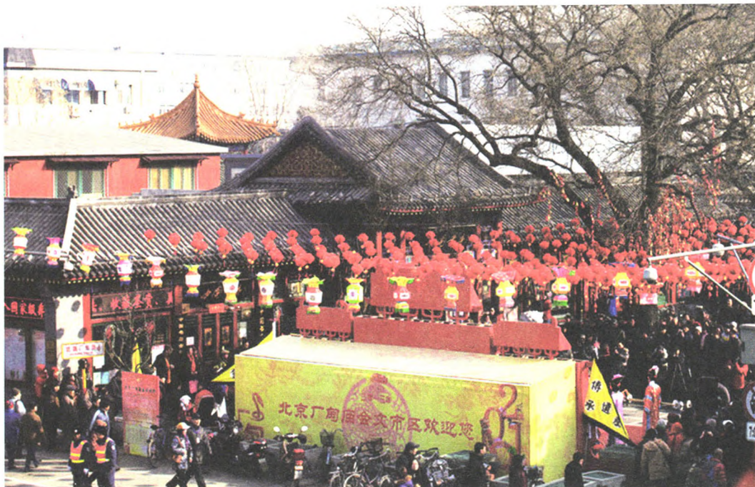
张灯结彩的厂甸庙会文市区