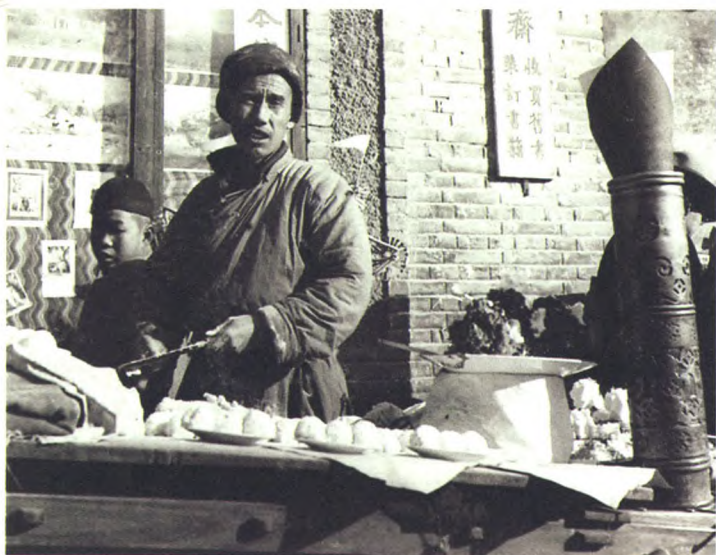
老北京厂甸庙会中艾窝窝食摊