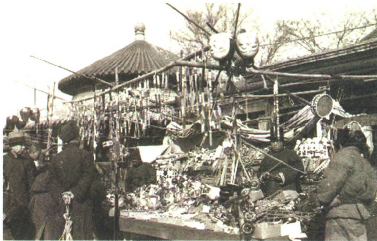
老北京厂甸庙会中的玩具摊位

宣武门外聚集了各省的会馆和来京赶考的外地考生,因此在琉璃厂附近,一些售卖书籍和笔墨纸砚的店铺应运而生并形成一定规模。琉璃厂是明清烧制琉璃瓦的官窑,后来随着规模的扩大,琉璃窑前的空地被称为厂甸,也就是现在东西琉璃厂十字路口东北角中国书店所在的位置。乾隆年间,每年的正月初一到十五元宵节,厂甸开辟为集市,由于依托火神庙、吕祖祠和土地祠三座庙宇,厂甸庙会由此得名。庙会期间,古玩商、珠宝商、书商聚集于此,连道路两边也摆满了售卖各种小物件的摊位。