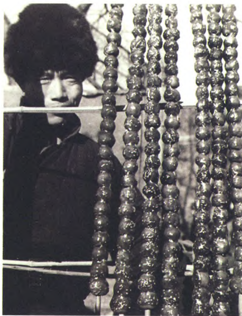
老北京厂甸庙会的传统小吃——五尺糖葫芦

在1963年这份厂甸庙会档案中,对参会的商户进行了严格的限定:市属各大百货商场,城区的国营、合营门市部和合作商