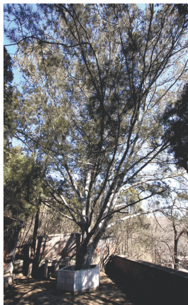
翠微四松中仅存的白皮松