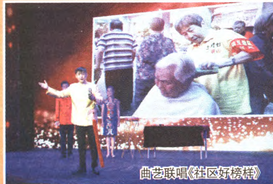
曲艺联唱《社区好榜样》