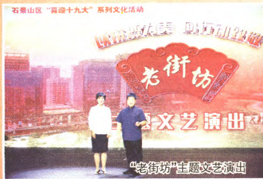
“老街坊”主题文艺演出