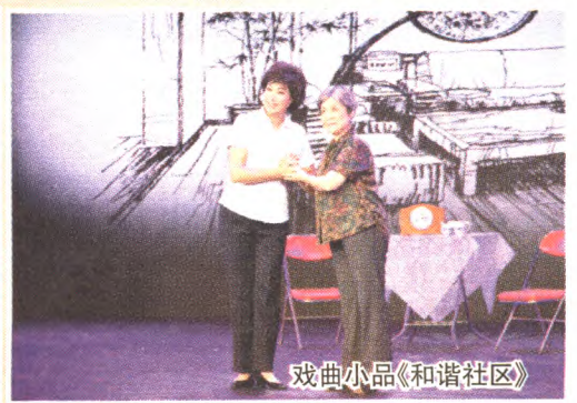
戏曲小品《和谐社区》