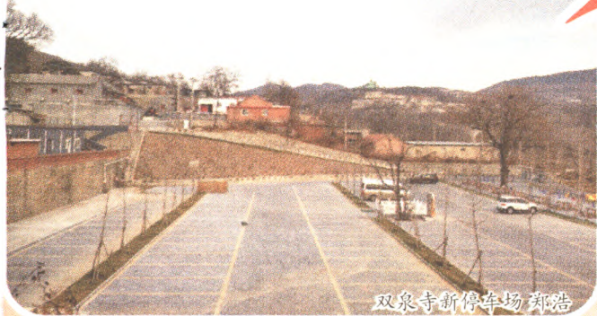
双泉寺新停车场 郑浩