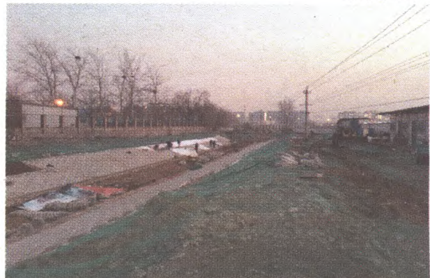
八大处沟治理工程施工现场