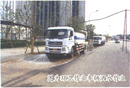
图为环卫作业车辆洒水作业

本报讯 进入秋季,天气干燥,风沙扬尘增多,同时也迎来了建筑施工的高峰期。为了更有效地抑制扬尘给环