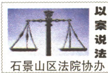
以案说法 石景山区法院协办