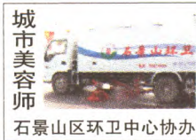
石景山区环卫中心协办