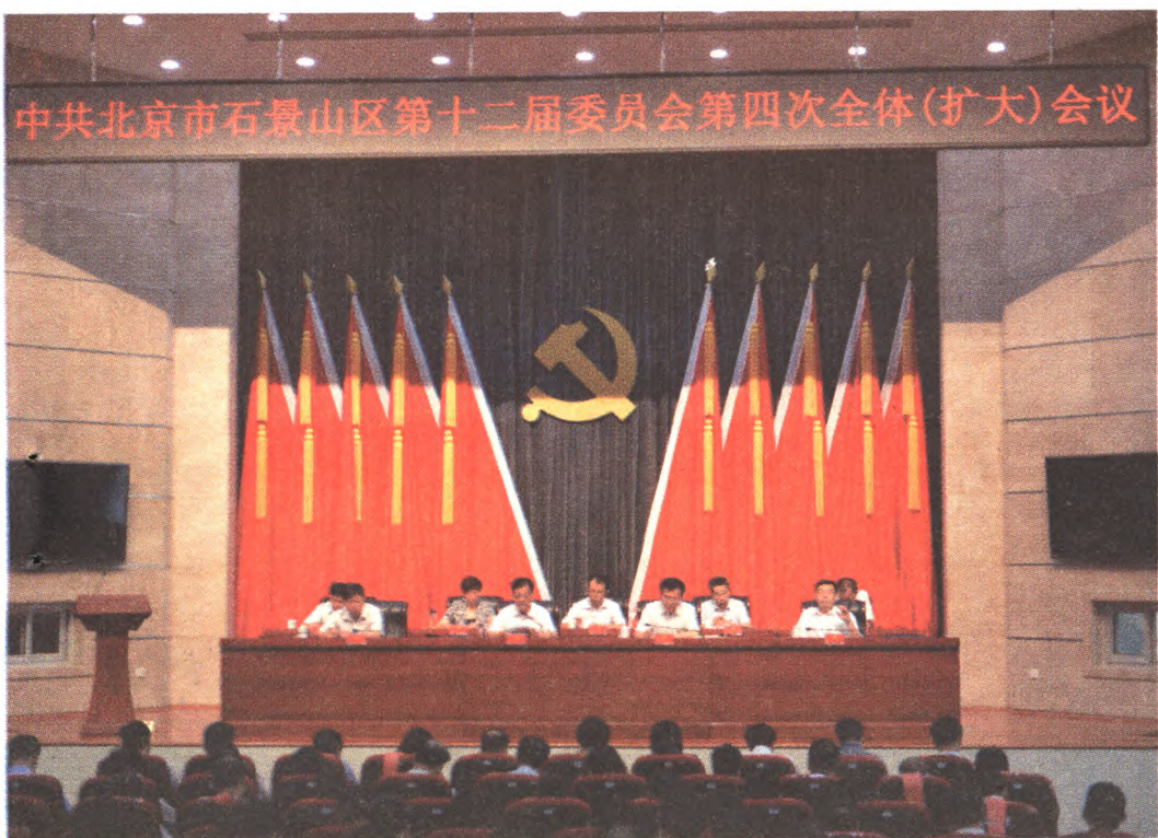
中共北京市石景山区第十二届委员会第四次全体(扩大)会议