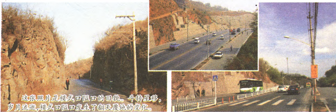
这张照片是模式口隘口的旧貌。斗转星移，岁月流逝，模式口隘口发生了翻天覆地的变化。

模式口，古称磨石口。中华民国十二年(1923年)改称今名。模式口隘口是出入京西的门户，为沟通京师与直隶、山西的要道。模式口隘口位于蟠龙山(俗称白家坡)和黑头山(俗称杨家坡)的交汇处。隘口起始年代不详。二百余年前，古隘口路窄坡陡，地势险要。清《日下旧闻考》载，“自南山磨石口登海会寺(古隘口山崖上，北有海藏寺，南有海会寺)，寺当山缺，远见卢沟桥在数十里外，桥柱历历可数。”“海藏寺径旁多嘉树，四山骈罗，寺若当缺口，殿方丈最高，望卢沟桥车骑可数。”足见隘口之高，地势之险。